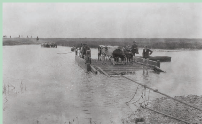
Køer fragtes over Ribe Å på trækpramme.

Indtil 1930'erne var der hver sommer folkelige Holmefester under høslætten.