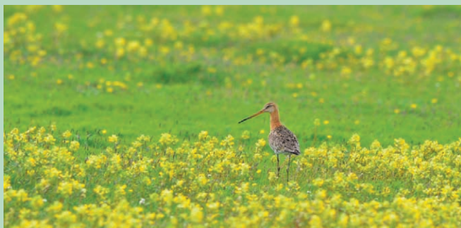
Kobbersneppe i marsken.

Nationalpark Vadehavet er levested for over 10.000 dyrearter. Her kommer årligt over 10 millioner trækfugle, og der er østers, muslinger og sæler. I Ribe Å lever laks, ørred, snæbel og oddere. Vegetationen varierer fra strandengene ved Ribe Ås udløb til engene nær geesten.