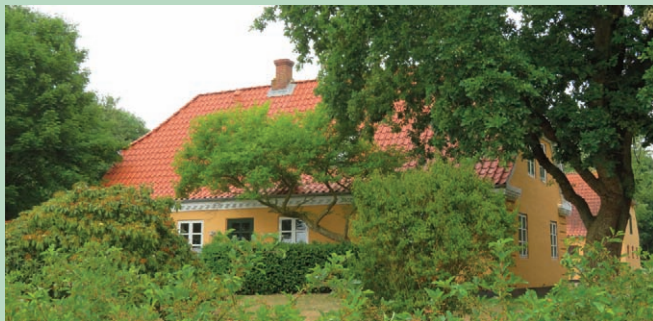
Forsøgsgården er i dag privatbolig.

Fra 1300 til 1600-tallet lå der to teglgårde, som brugte marskens klæg og leverede sten til Ribe. Statens Marskforsøg havde en forsøgsgård 1923-1971.