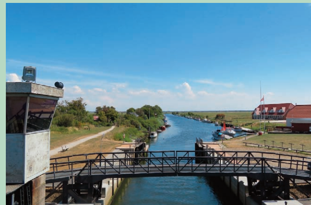
Kammerslusen lukkes ved stormflod og sikrer på den måde marskens beboere.

I Kanalhuset har der været kro og karantænestation.