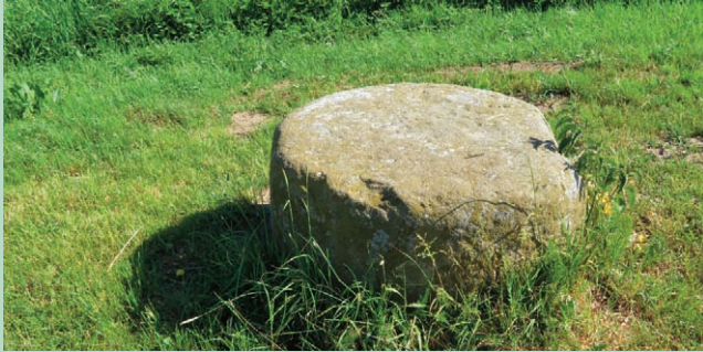
Ifølge et gammelt sagn boede der en kæmpe eller trolld på Mandø. Han ville ramme Ribe Domkirke med den store sten - og hans "fingeraftryk" findes endnu på stenen.