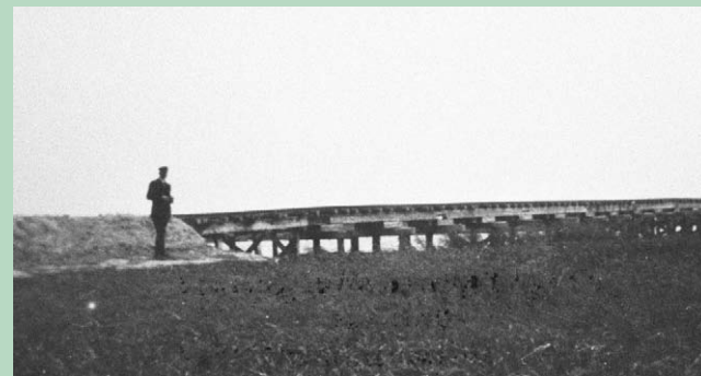
Mergelbanebroen over Ribe Holme i 1930.

Fra sidst i 1800-tallet og indtil midten af 1900-tallet blev Danmarks sure landbrugsjord merglet. Ved Klåbygård var der 1910-1951 to mergellejer, som ved hjælp af små jernbanespor tilknyttet hovedbanenettet forsynede indlandet og marsken med den kalkrige mergel.