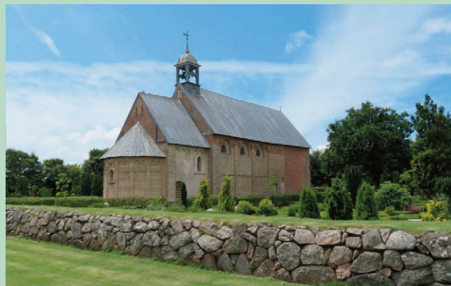
Hviding Kirke.

Den vulkanske stenart tufsten blev brugt til mange kirkebyggerier i Vadehavsområdet. Fem af de seks nærmeste kirker er helt eller delvist af tufsten: Ribe Domkirke og kirkerne i Vilslev, Farup, Vester Vedsted og Hviding. Skt. Catharinæ Kirke er af munkesten.